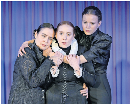
Zum letzten Mal: „Eine Frau“ am 8. und 18. Januar.