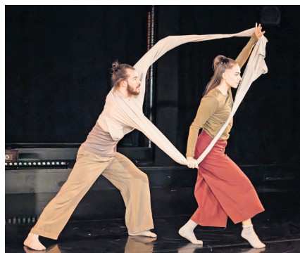
1 Tanzabend – 5 Choreografien: „Perspectives“ am 8. und 31. Dezember.