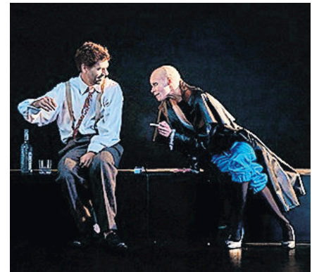
Gut und Böse, Suchen, Sehnen, Magie, Liebe, Betrug, Mord: „Urfaust“ am 27. Januar.